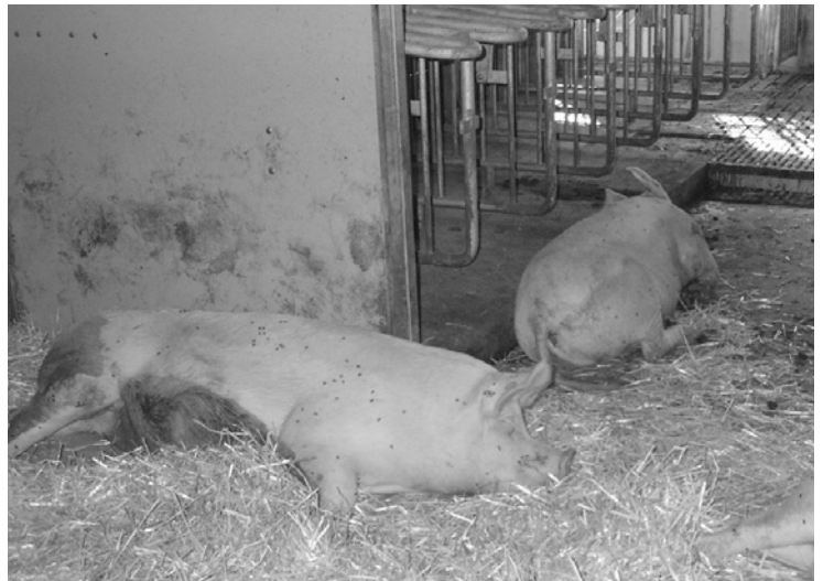
Vier-Flächen-Bucht mit Fressliegeboxen, Laufgang, eingestreutem Liegebereich und Auslauf .

Während Sauen, die sich nicht kennen, beim Gruppieren heftige Rankämpfe ausführen, kämpfen abgesetzte Sauen, welche sich vom Wartestall her kennen, in der Regel kaum miteinander. Es ist deswegen wichtig, dass man möglichst immer dieselben Sauen nach dem Absetzen zusammenbringt. Auch Sauen aus einer Grossgruppe kennen einander, und es gibt weniger Auseinandersetzungen. Da es sich allerdings manchmal nicht vermeiden lässt, Sauen aus verschiedenen Gruppen, zum Beispiel «Umrauscher», neu in eine Gruppe zu bringen, ist es von Vorteil, ein oder zwei separate Buchten zu haben, in welchen man die neuen Tiere solange halten kann, bis sich das Gesäuge der frisch abgesetzten Sauen zurückgebildet hat. Dieses ist bei Kämpfen nämlich besonders gefährdet.