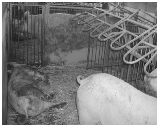
Drei-Flächen-Bucht mit Fressliegeboxen, Laufgang, und Auslauf. Ein separater Liegebereich fehlt.

Ein erster Schritt, auf Einzelstände zu verzichten, war der Einbau von Fressliegeboxen mit einem Laufgang dahinter und meistens mit einem Auslauf, die sogenannten Drei-Flächen-Buchten. Wenn die Tiere in diesen Buchten in Ruhe liegen möchten, müssen sie dazu die Fressliegeboxen nutzen. Die Tiere können nicht zusammen liegen und sich vor allem im Winter nicht gegenseitig wärmen. Dies ist nur bei einem separaten Gemeinschafts-Liegeplatz in der Vier-Flächen-Bucht möglich. Die vierte Fläche bringt auch dem Tierhalter Vorteile, da dann in den Fressliegeboxen kaum Mist anfällt.