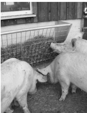
Heuraufe im Auslauf zur Beschäftigung.

Nach dem Absetzen füttert man Sauen zurückhaltend. Die restriktive Fütterung hat zum Ziel, die Milchproduktion im Gesäuge zu verringern und den sogenannten Flushing Effekt zur Stimulation der Rausche zu verstärken. Der Flushing Effekt entsteht dadurch, dass man Sauen nach einem kurzen Fasten wieder mehr Futter verabreicht, so dass es zu einem „Energieschoss“ kommt. Die Sauen haben also vor allem in den ersten Tagen nach dem Absetzen Hunger. Es ist deswegen wichtig, dass sie gerade in dieser Zeit rohfaserreiches Material wie Heu, Stroh, Chinaschilf oder Silage aufnehmen und sich damit beschäftigen können. Man sollte dieses wenigstens zwei Mal am Tag in einer Raufe oder direkt im Trog anbieten. Es ist falsch, den Sauen am ersten Tag nach dem Absetzen gar kein Futter zu geben, da sie auf eine solche abrupte Umstellung physiologisch nicht vorbereitet sind. Richtig ist es, die Sauen und die Ferkel schon in der Abferkelbucht auf das Absetzen vorzubereiten und beim Absetzen auf ein rohfaserreicherer Sauen-Futter umzustellen. Während der Umstellungsphase von der Einzel- in die Gruppenhaltung, während der Rausche und insbesondere beim Einführen neuer Tiere muss der Tierhalter seine Tiere gut beobachten und eventuell steuernd eingreifen, zum Beispiel, indem er ein Tier aus der Gruppe herausnimmt oder kurzzeitig in einer Fressliegebox einsperrt. Auf diese Weise lässt sich der soziale Stress vermindern.